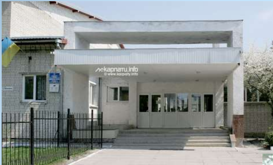
М. Львів, єдиний у світі музей Квітки Цісик