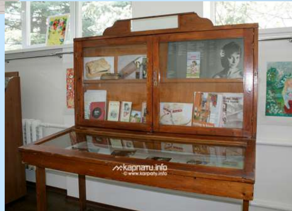
Експонат музею Квітки Цісик

Творчий доробок співачки дуже великий та найприємніше знати, що українські альбоми співачки у 1990 році були номіновані на премію «Греммі» в категорії «Найкращий альбом сучасної народної музики».